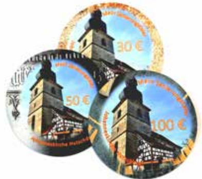
Detail vom Taler: